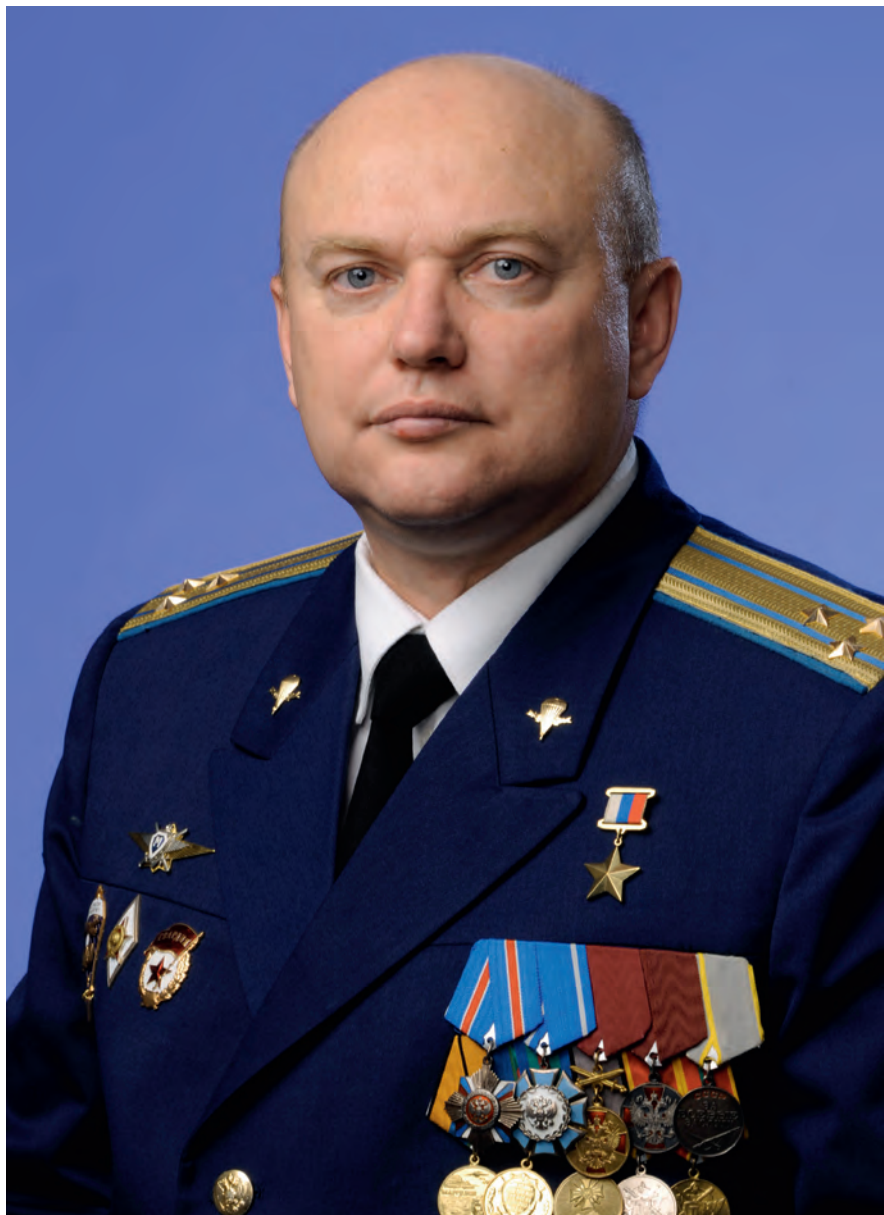
Первый заместитель председателя Комитета Государственной Думы по обороне Андрей Леонидович Красов