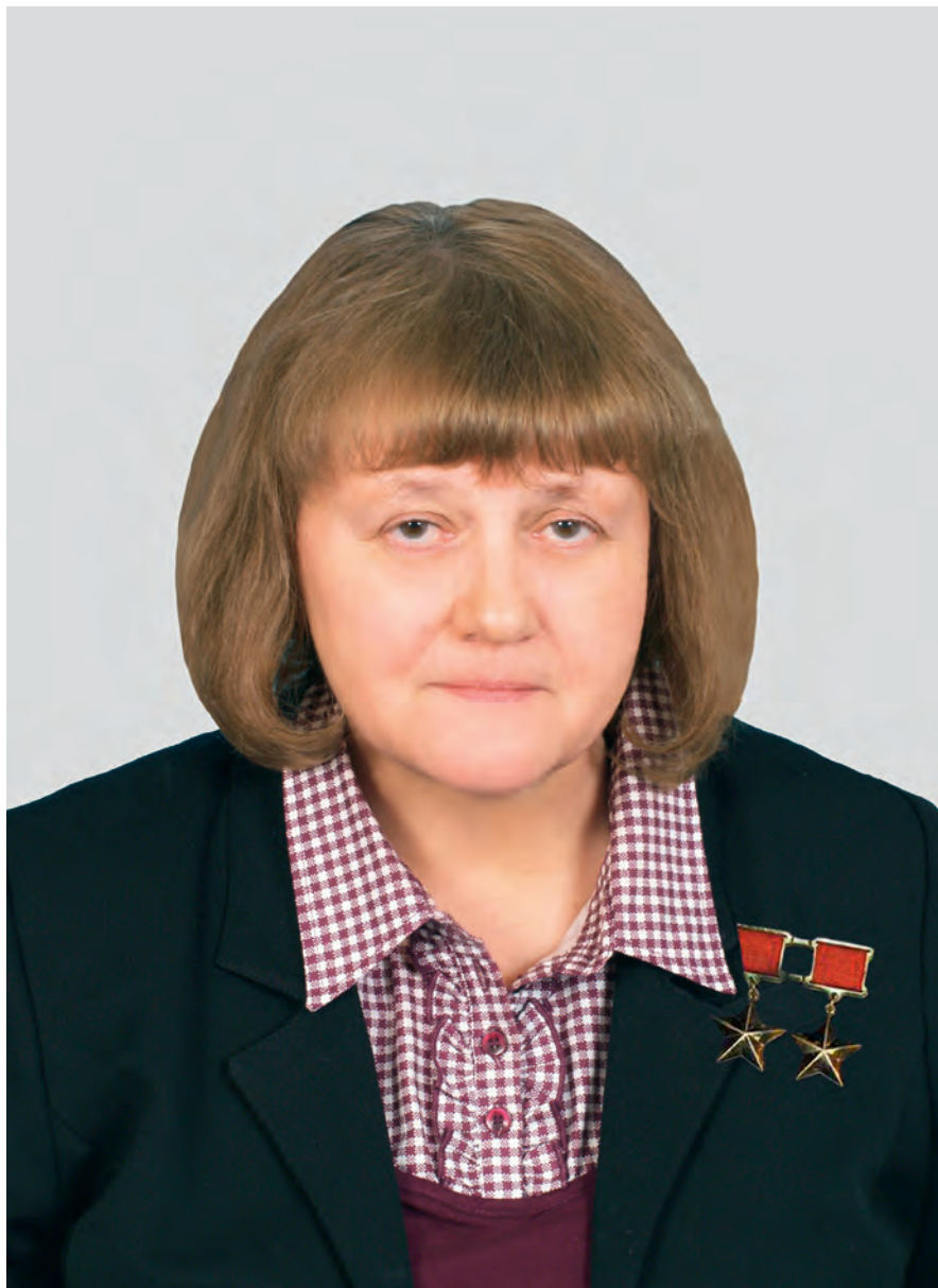
Заместитель председателя Комитета Государственной Думы по обороне Светлана Евгеньевна Савицкая