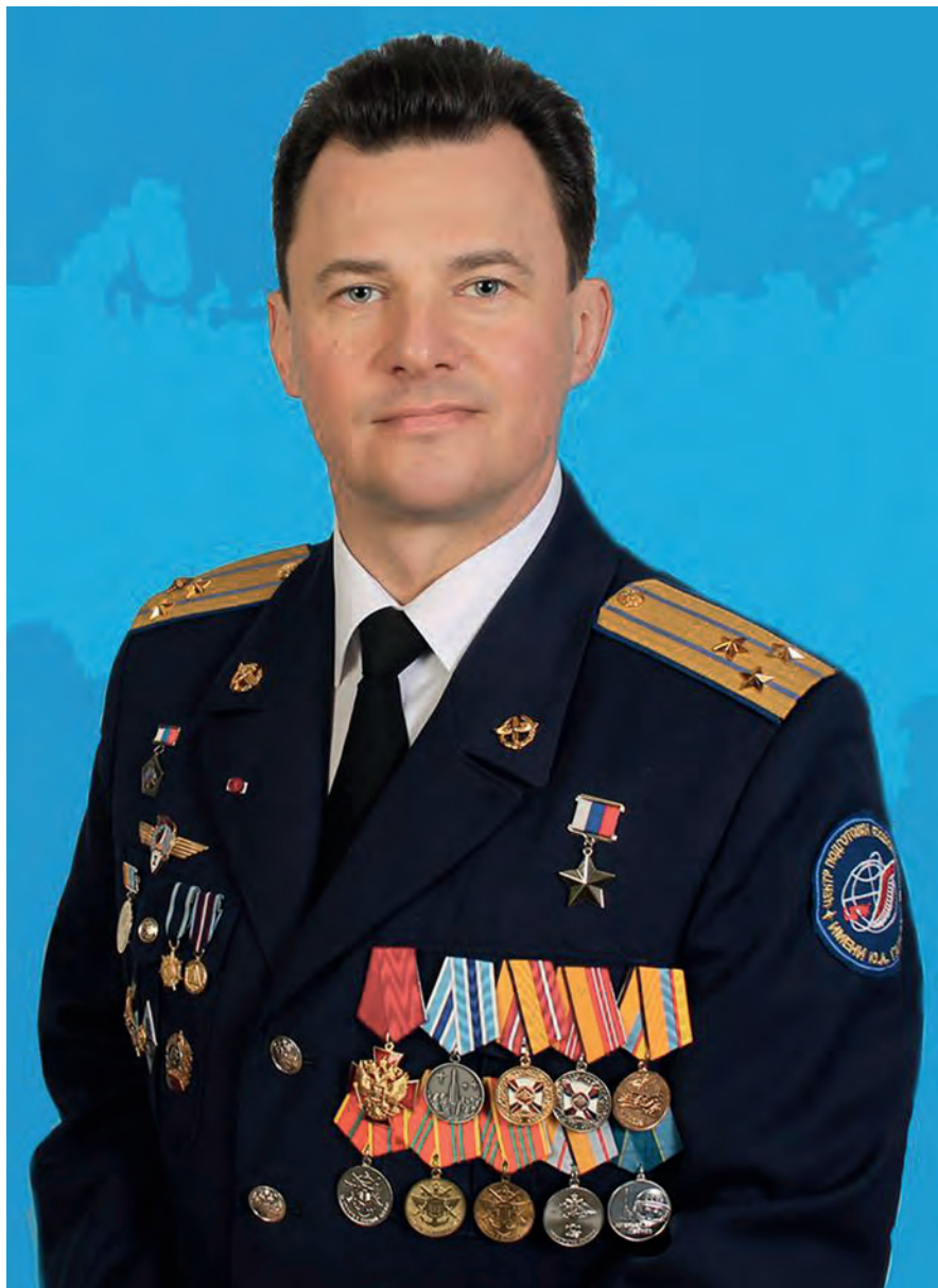
Член Комитета Государственной Думы по обороне Роман Юрьевич Романенко