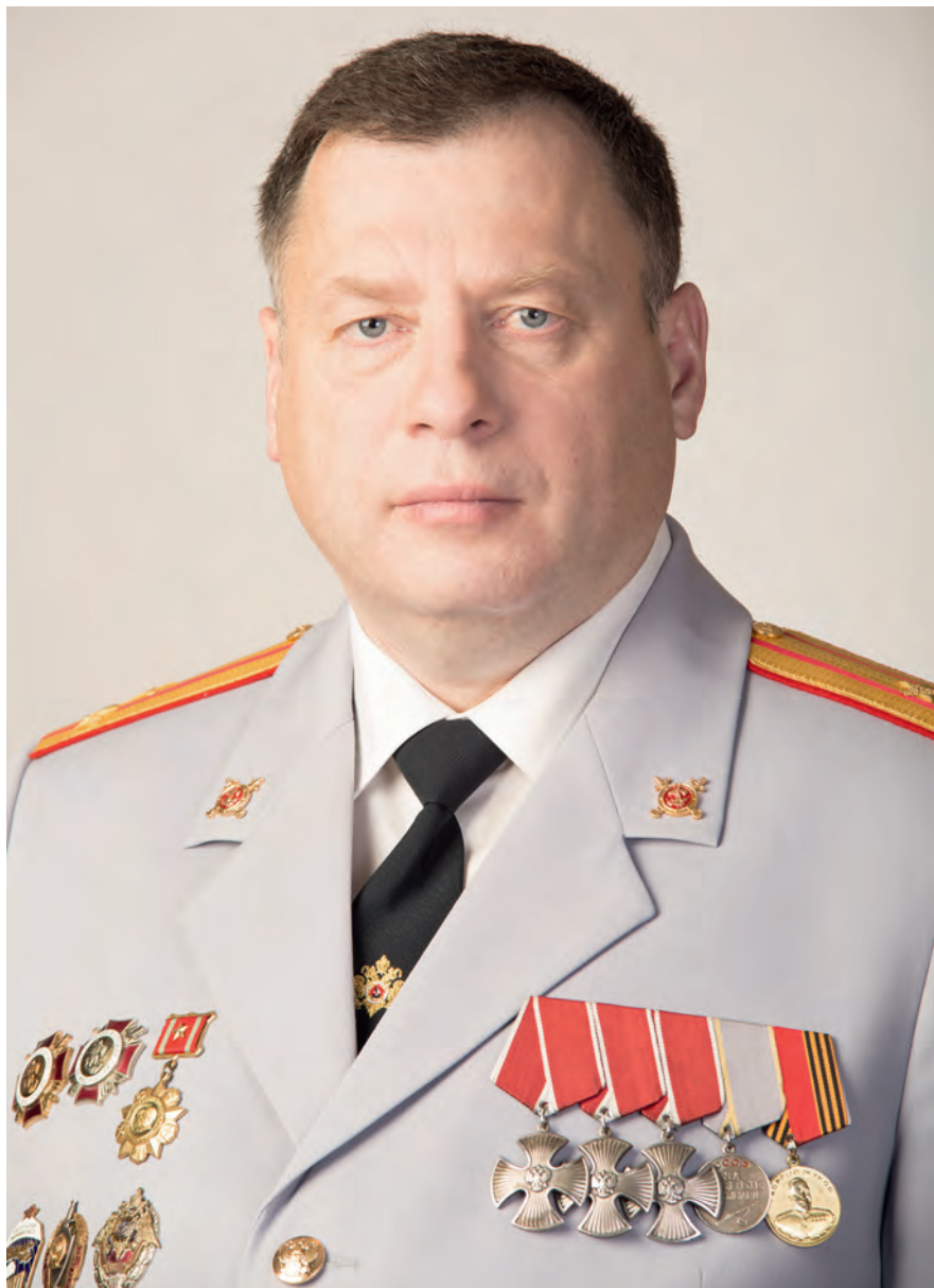
Заместитель председателя Комитета Государственной Думы по обороне Юрий Николаевич Швыткин