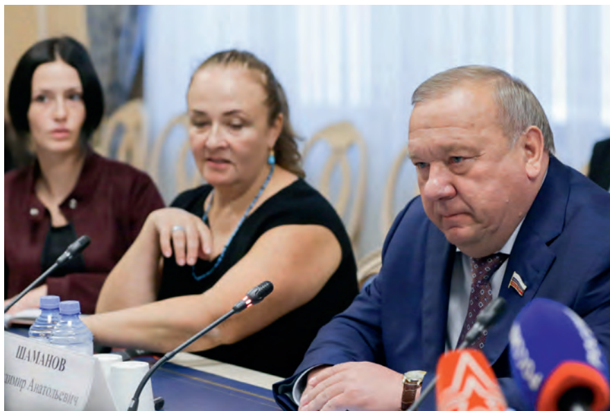
Совещание с представителями ветеранских организаций по подготовке к памятным мероприятиям по случаю 30-летия вывода ограниченного контингента советских войск из Афганистана (июль 2018 года)