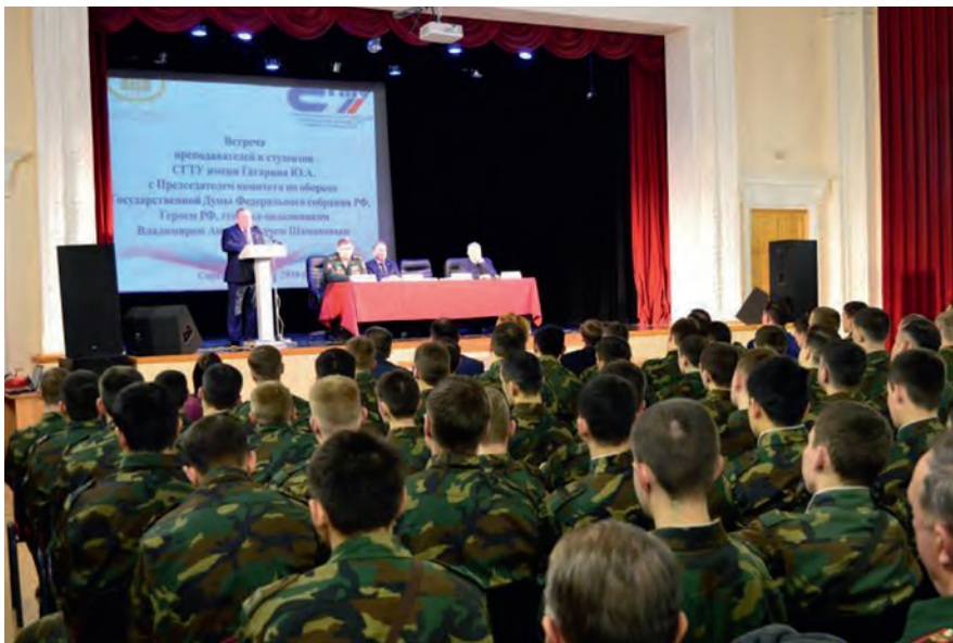
Торжественный митинг, посвященный 20-летию образования 31-й отдельной гвардейской десантно-штурмовой ордена Кутузова бригады (май 2018 года, Ульяновск)