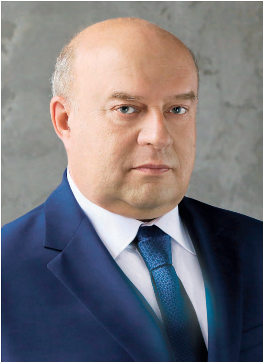
Член Комитета Государственной Думы по обороне Алексей Алексеевич Хохлов