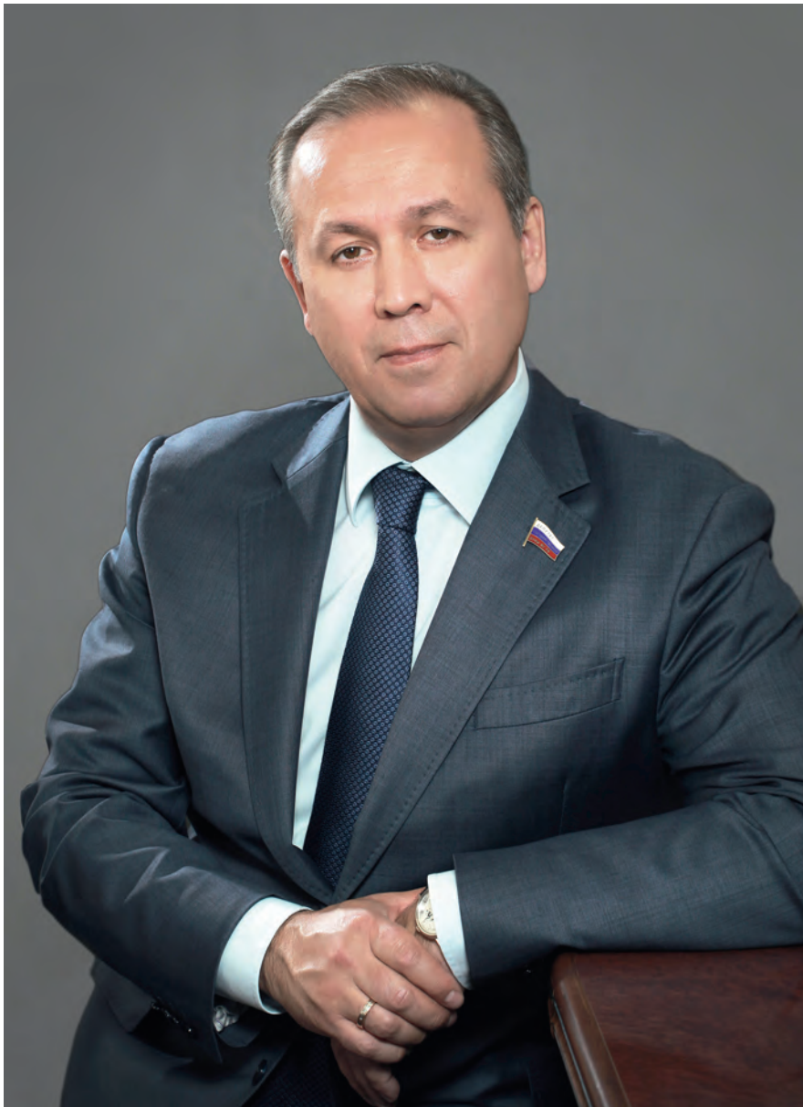
Член Комитета Государственной Думы по обороне Ринат Шамильевич Хайров