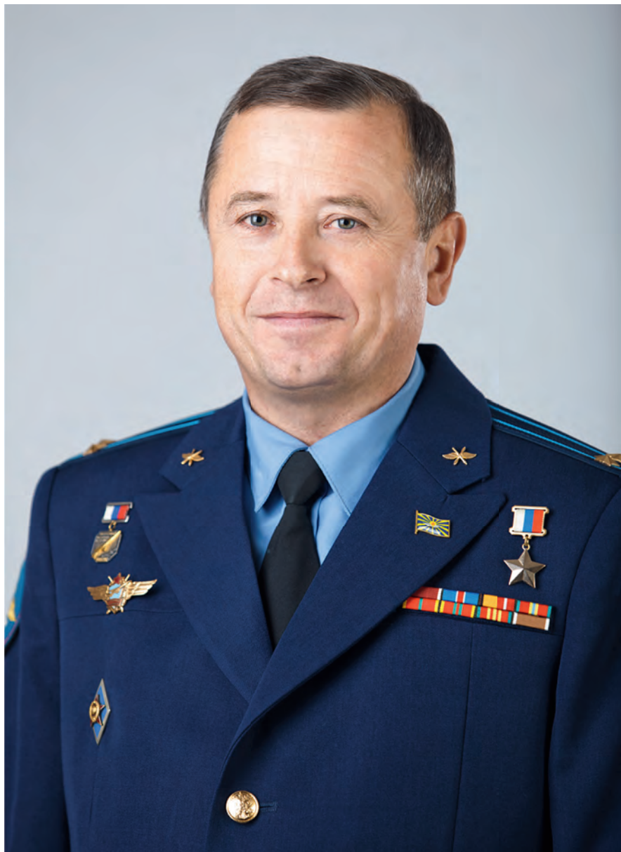
Член Комитета Государственной Думы по обороне Владимир Иванович Богодухов