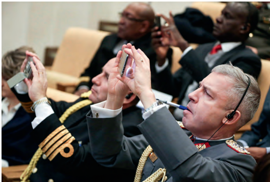
Торжественное открытие выставки Комитета Государственной Думы по обороне на тему «История Первого Московского кадетского корпуса» (23 марта 2018 года)