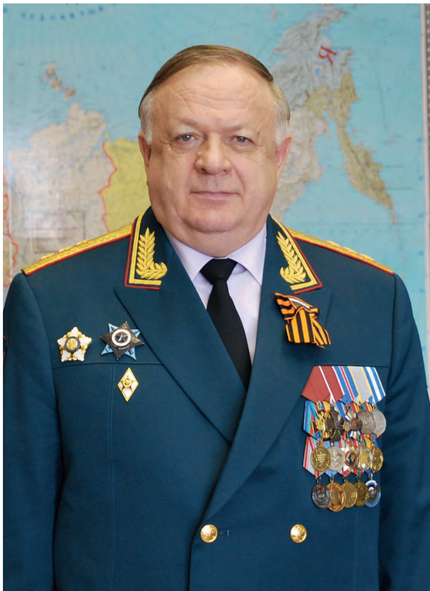
Заместитель председателя Комитета Государственной Думы по обороне Виктор Михайлович Заварзин