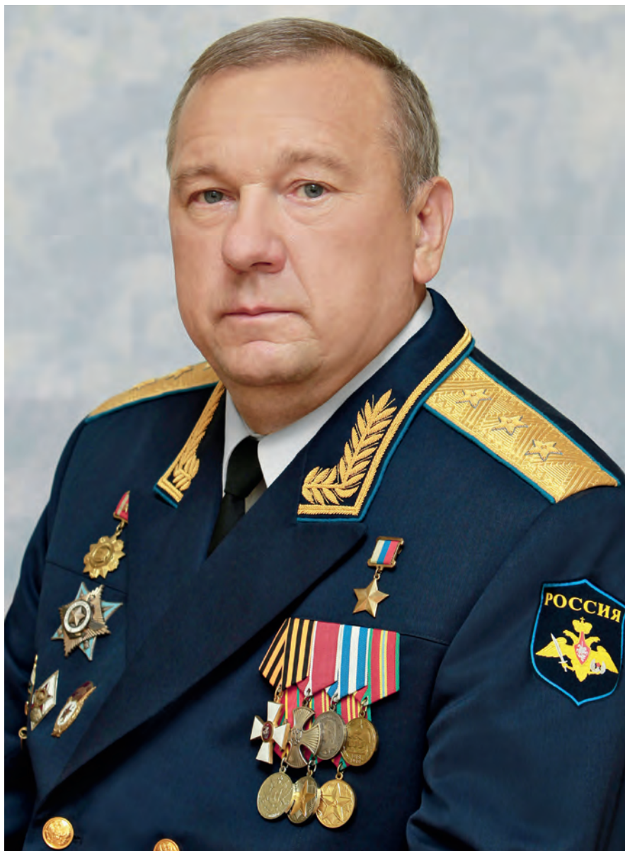
Председатель Комитета Государственной Думы по обороне Владимир Анатольевич Шаманов