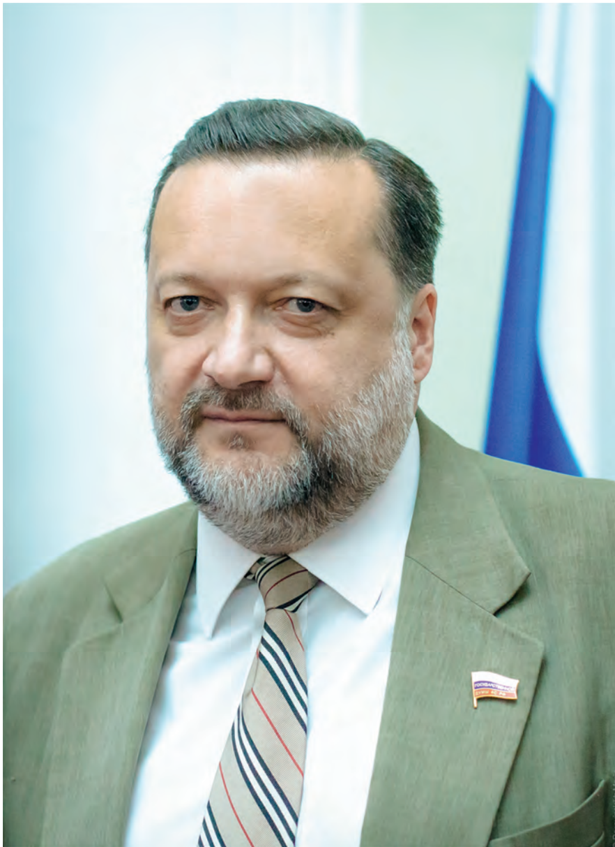
Член Комитета Государственной Думы по обороне Павел Сергеевич Дорохин