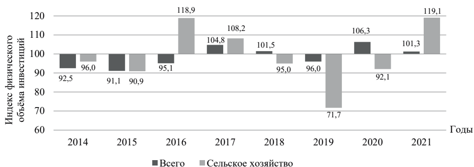
Рис. 2. Индекс физического объема инвестиций в основной капитал, направленных на реконструкцию и модернизацию, по видам экономической деятельности

Недостаточно благоприятный инвестиционный климат обусловлен, на наш взгляд, низкой инвестиционной привлекательностью, которая вызвана рядом особенностей, присущих сельскохозяйственному производству: низкая рентабельность, продолжительная окупаемость и высокие риски сельскохозяйственного производства. Фактическое состояние процесса инвестирования