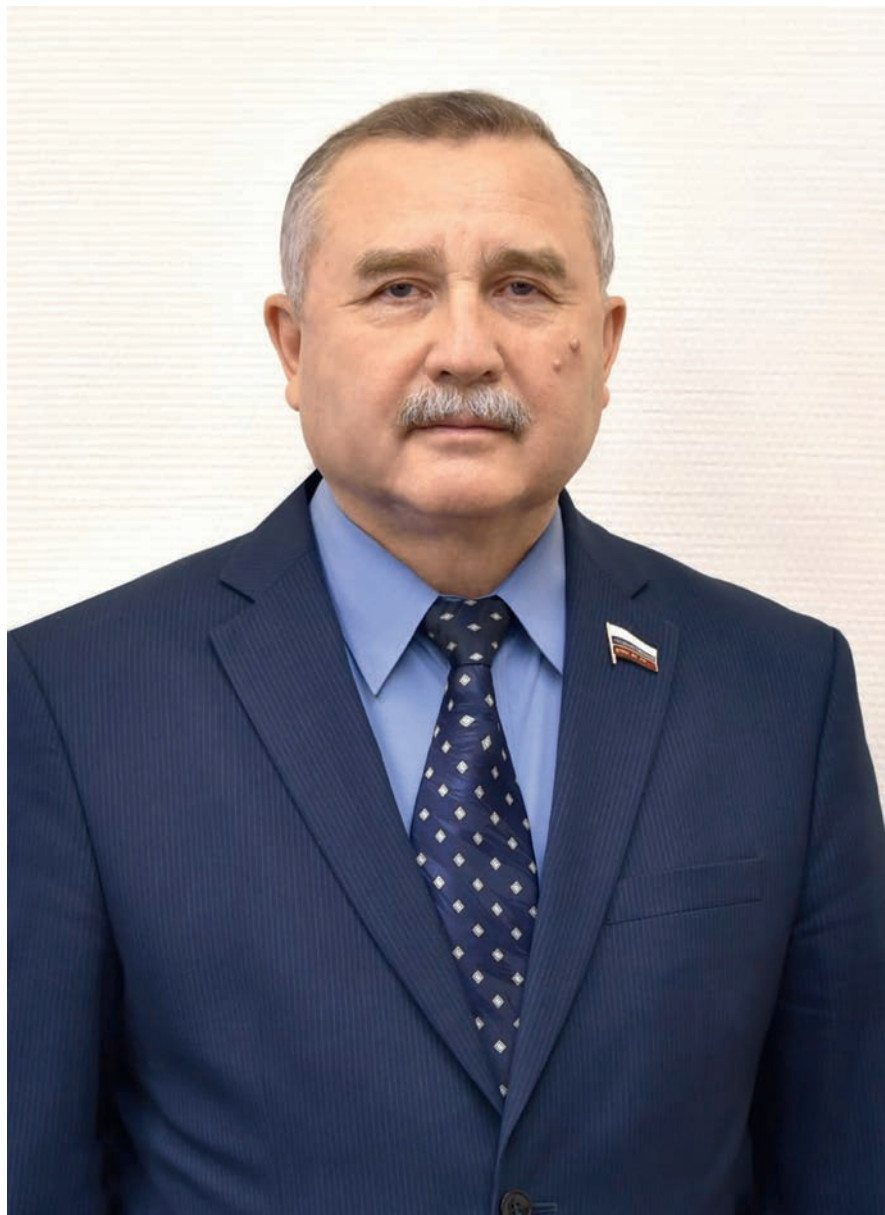
Член Комитета Государственной Думы по обороне Иван Михайлович Тетерин