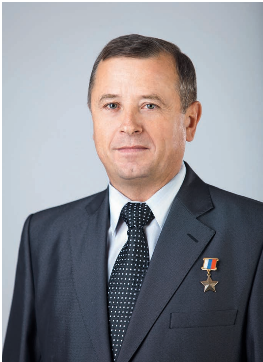
Член Комитета Государственной Думы по обороне Владимир Иванович Богодухов