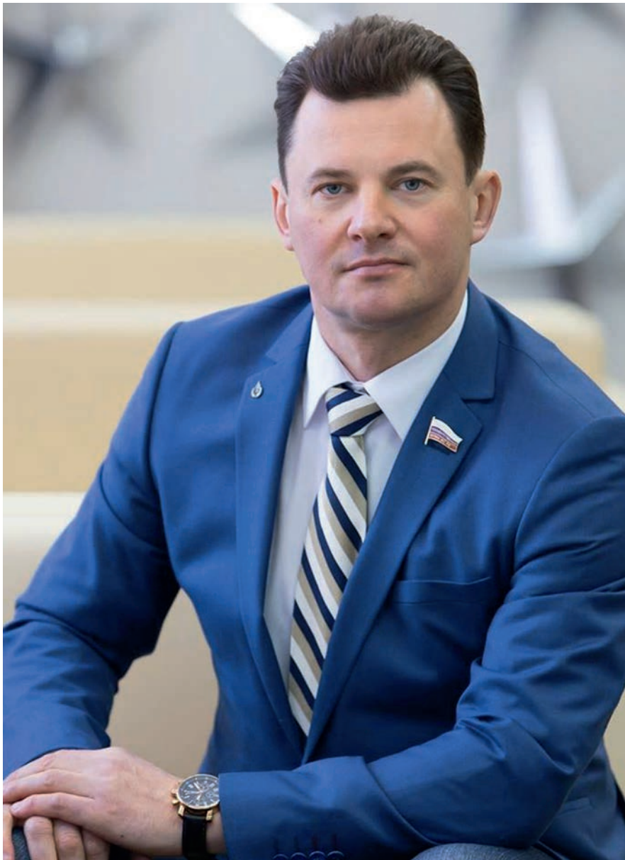
Член Комитета Государственной Думы по обороне Роман Юрьевич Романенко