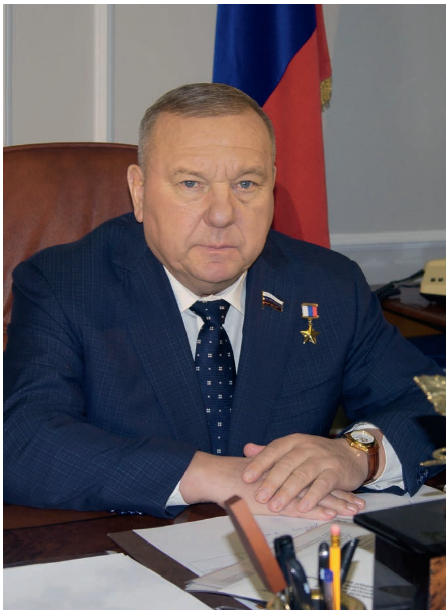
Председатель Комитета Государственной Думы по обороне Владимир Анатольевич Шаманов