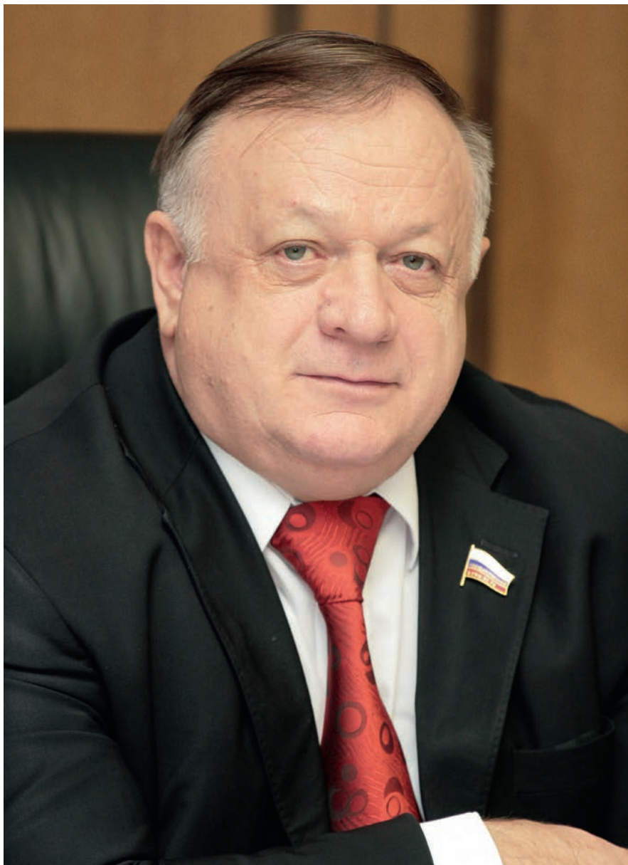
Заместитель председателя Комитета Государственной Думы по обороне Виктор Михайлович Заварзин