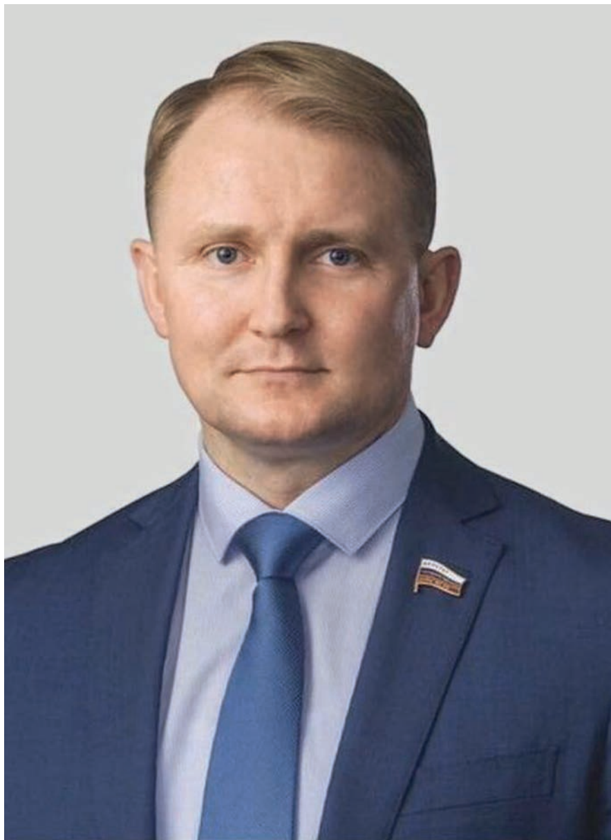
Первый заместитель председателя Комитета Государственной Думы по обороне Александр Николаевич Шерин