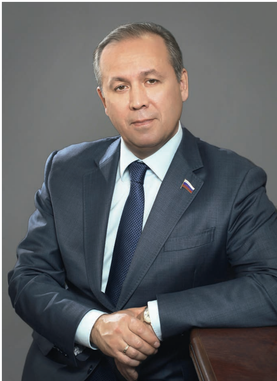
Член Комитета Государственной Думы по обороне Ринат Шамильевич Хайров