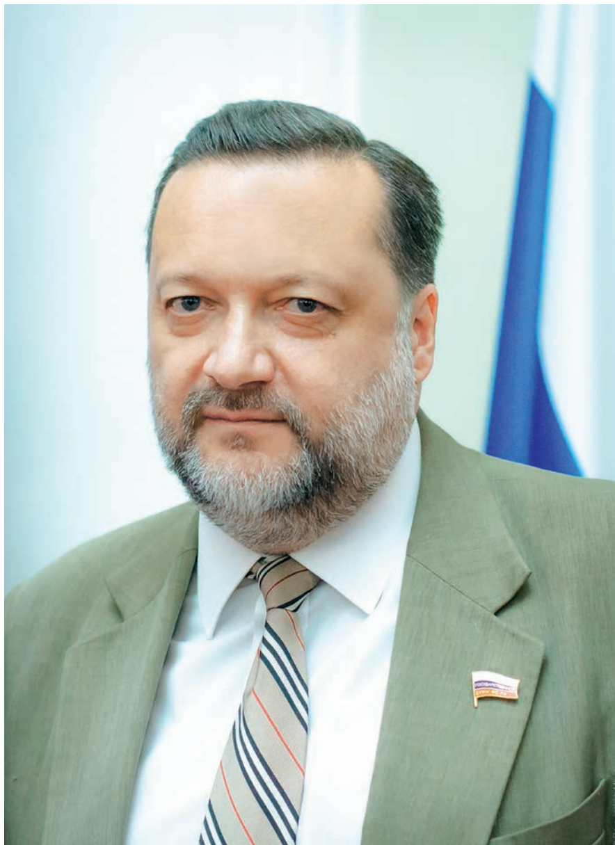
Член Комитета Государственной Думы по обороне Павел Сергеевич Дорохин