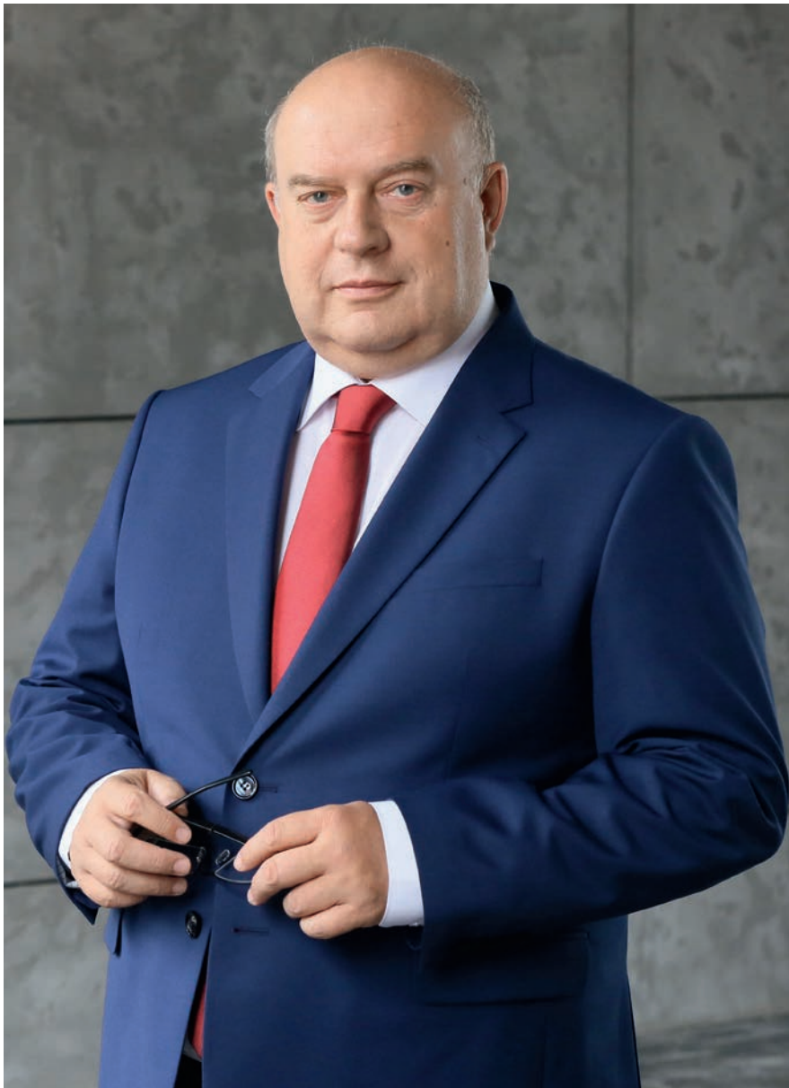
Член Комитета Государственной Думы по обороне Алексей Алексеевич Хохлов