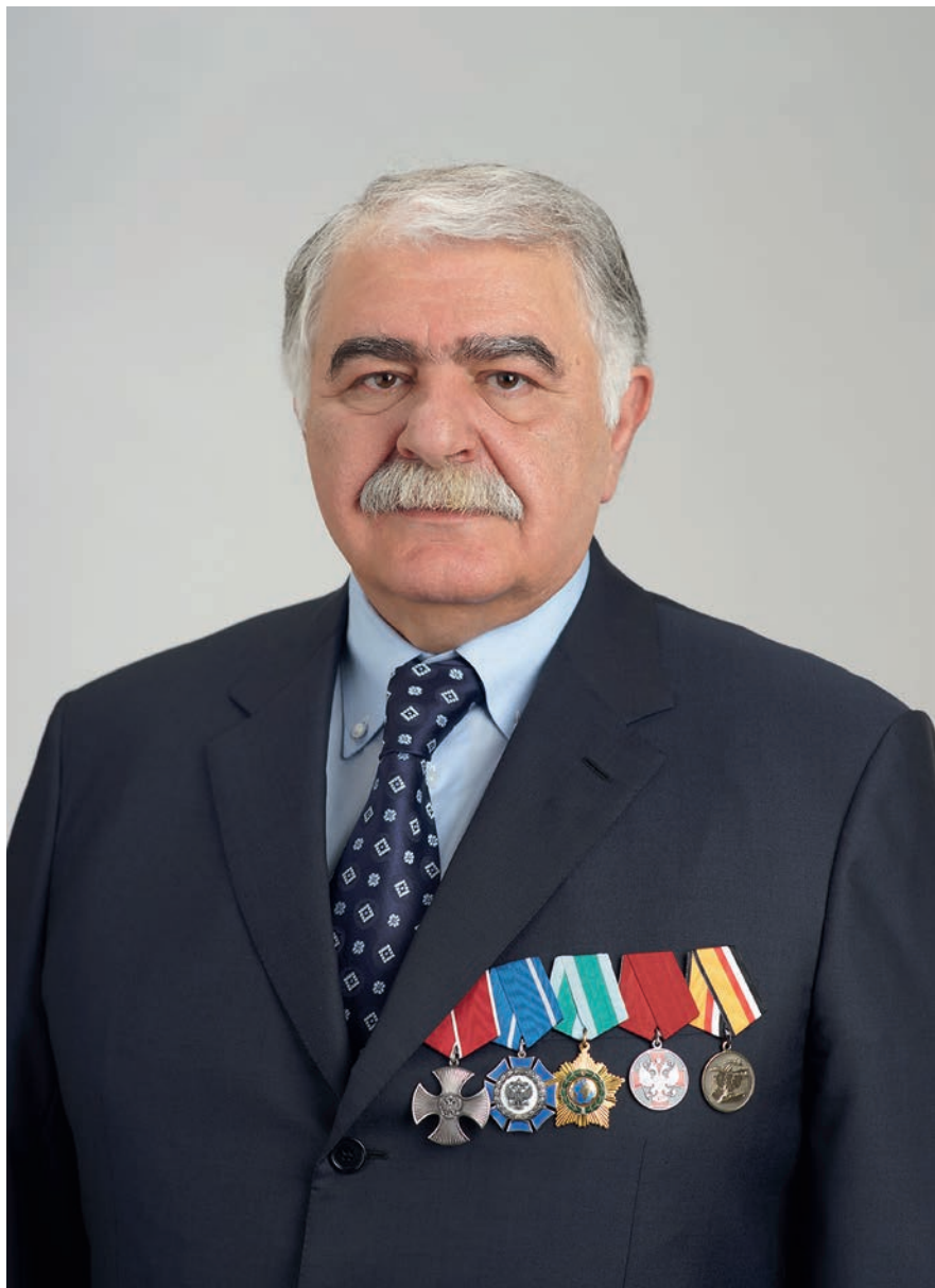
Член Комитета Государственной Думы по обороне Зелимхан Аликоевич Муцоев