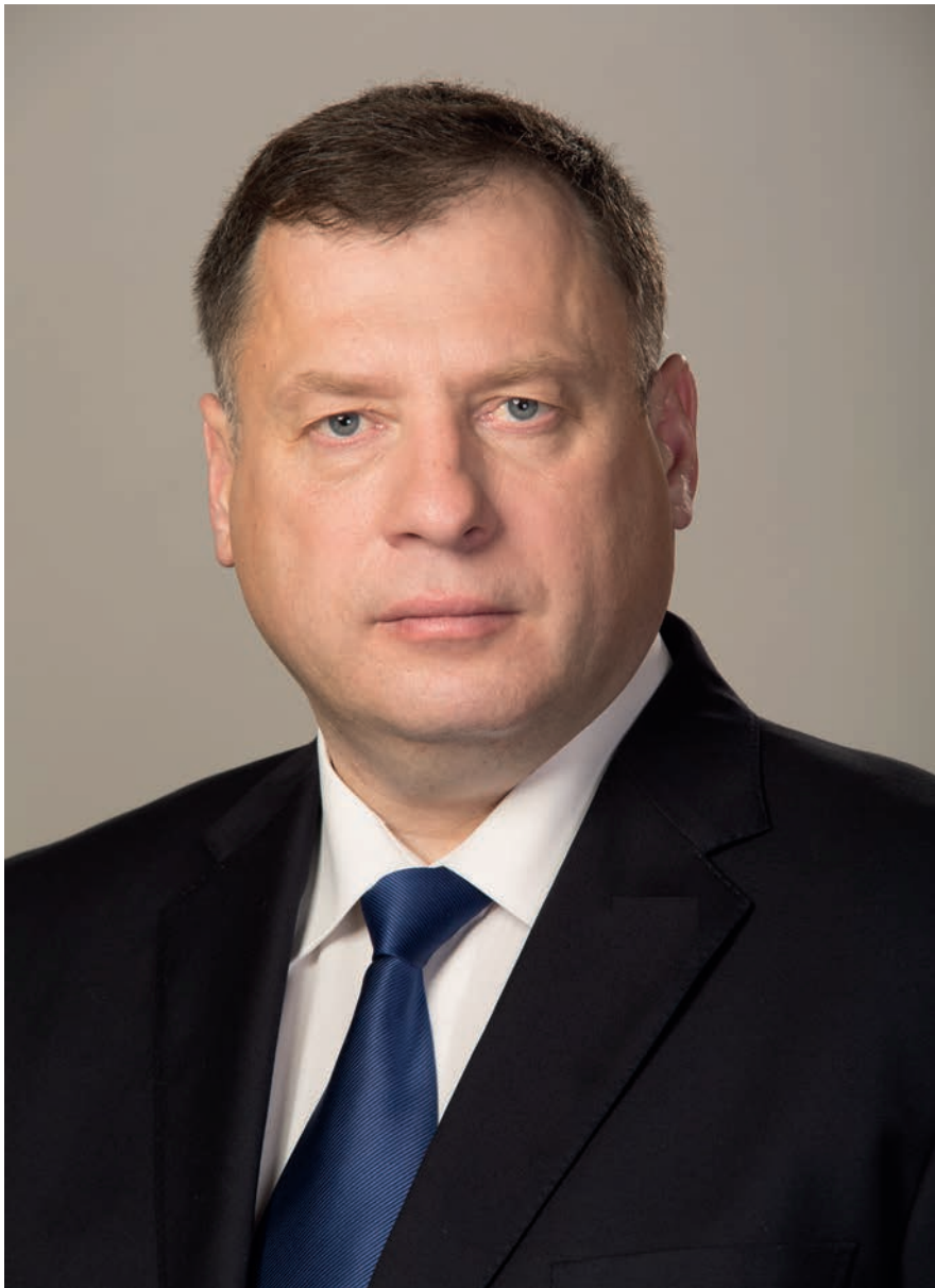
Заместитель председателя Комитета Государственной Думы по обороне Юрий Николаевич Швыткин