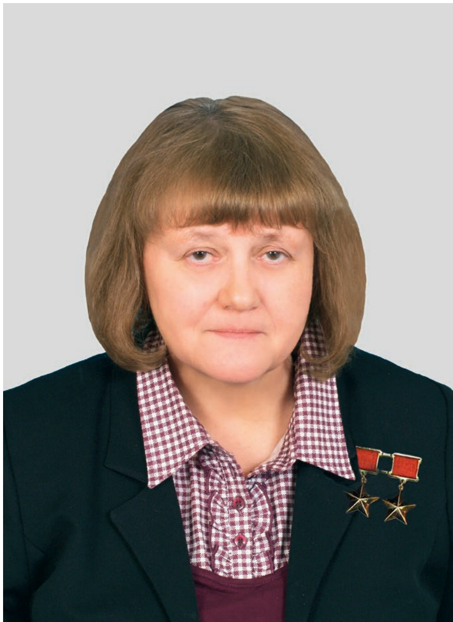
Заместитель председателя Комитета Государственной Думы по обороне Светлана Евгеньевна Савицкая