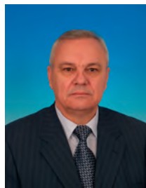
Решульский Сергей Николаевич, первый заместитель руководителя фракции КППФ в Государственной Думе, член Комитета Государственной Думы по делам Федерации и региональной политике