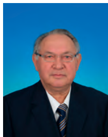
Маслюков Юрий Дмитриевич, депутат Государственной Думы, председатель Комитета Государственной Думы по промышленности