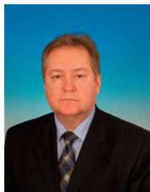
Обухов Сергей Павлович, депутат Государственной Думы, член Комитета Государственной Думы по делам общественных объединений и религиозных организаций