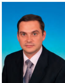
Ширшов Константин Владимирович, депутат Государственной Думы, член Комитета Государственной Думы по промышленности