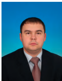
Афонин Юрий Вячеславович, депутат Государственной Думы, член Комитета Государственной Думы по делам молодёжи