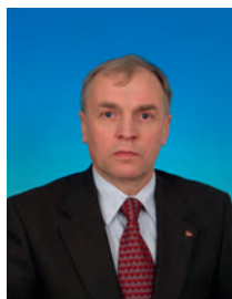
Кашин Борис Сергеевич, депутат Государственной Думы, член Комитета Государственной Думы по финансовому рынку