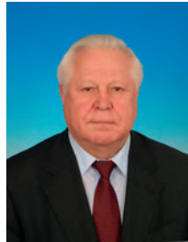
Купцов Валентин Александрович, депутат Государственной Думы, председатель Комитета Государственной Думы по делам национальностей