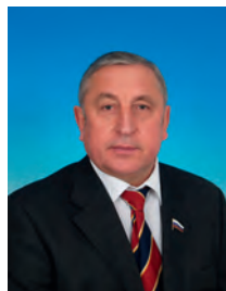
Харитонов Николай Михайлович, депутат Государственной Думы, первый заместитель председателя Комитета Государственной Думы по аграрным вопросам