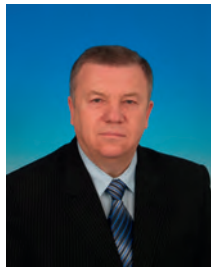
Комоседов Владимир Петрович, депутат Государственной Думы, член Комитета Государственной Думы по обороне