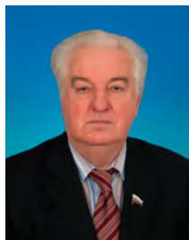
Гостев Руслан Георгиевич, депутат Государственной Думы, член Комитета Государственной Думы по физической культуре и спорту