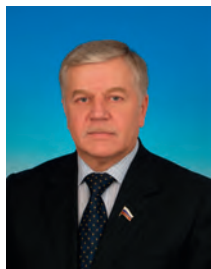
Собко Сергей Васильевич, депутат Государственной Думы, председатель Комитета Государственной Думы по промышленности