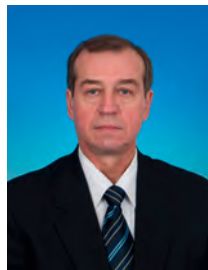
Левченко Сергей Георгиевич, депутат Государственной Думы, член Комитета Государственной Думы по энергетике