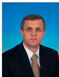
Коломейцев Николай Васильевич, депутат Государственной Думы, член Комитета Государственной Думы по труду и социальной политике