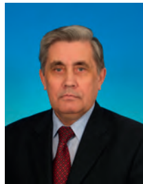
Шурчанов Валентин Сергеевич, депутат Государственной Думы, член Комитета Государственной Думы по делам Федерации и региональной политике