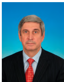
Мельников Иван Иванович, депутат Государственной Думы, заместитель Председателя Государственной Думы, член Комитета Государственной Думы по образованию