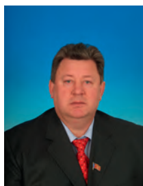
Кашин Владимир Иванович, депутат Государственной Думы, заместитель председателя Комитета Государственной Думы по природным ресурсам, природопользованию и экологии