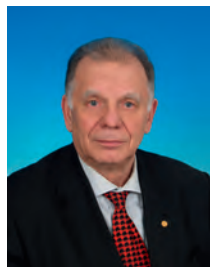
Алфёров Жорес Иванович, депутат Государственной Думы, член Комитета Государственной Думы по науке и наукоёмким технологиям