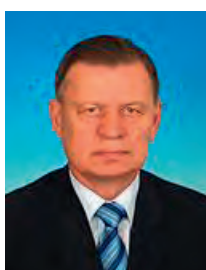
Сапожников Николай Иванович, депутат Государственной Думы с апреля 2010 года, заместитель председателя Комитета Государственной Думы по промышленности