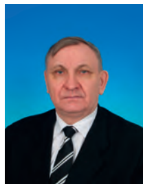
Пономарёв Алексей Алексеевич, депутат Государственной Думы, член Комитета Государственной Думы по Регламенту и организации работы Государственной Думы