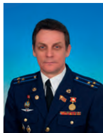
Улас Владимир Дмитриевич, депутат Государственной Думы, член Комитета Государственной Думы по бюджету и налогам