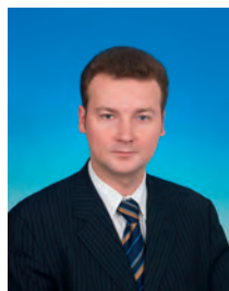
Андреев Андрей Анатольевич, депутат Государственной Думы, член Комитета Государственной Думы по информационной политике, информационным технологиям и связи