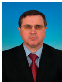
Смолин Олег Николаевич, депутат Государственной Думы, заместитель председателя Комитета Государственной Думы по образованию