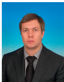
Русских Алексей Юрьевич, депутат Государственной Думы, заместитель председателя Комитета Государственной Думы по науке и наукоёмким технологиям