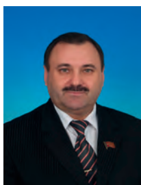
Свечников Пётр Григорьевич, депутат Государственной Думы, член Комитета Государственной Думы по аграрным вопросам