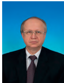
Куликов Олег Анатольевич, депутат Государственной Думы, член Комитета Государственной Думы по охране здоровья