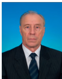
Сокол Святослав Михайлович, депутат Государственной Думы, член Комитета Государственной Думы по промышленности