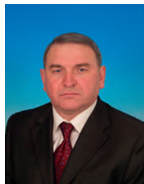
Эдель Игорь Олегович, депутат Государственной Думы, член Комитета Государственной Думы по транспорту