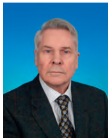
Чикин Валентин Васильевич, депутат Государственной Думы, член Комитета Государственной Думы по информационной политике, информационным технологиям и связи