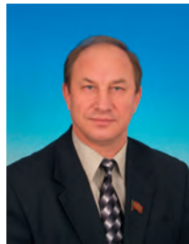
Рашкин Валерий Фёдорович, депутат Государственной Думы, член Комитета Государственной Думы по Регламенту и организации работы Государственной Думы