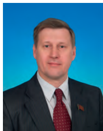
Локоть Анатолий Евгеньевич, заместитель руководителя фракции КПРФ в Государственной Думе, член Комитета Государственной Думы по вопросам местного самоуправления