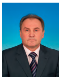
Езерский Николай Николаевич, депутат Государственной Думы, член Комитета Государственной Думы по безопасности