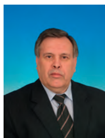
Илюхин Виктор Иванович, депутат Государственной Думы, заместитель председателя Комитета Государственной Думы по конституционному законодательству и государственному строительству