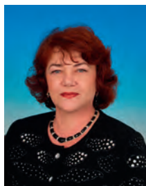
Плетнёва Тамара Васильевна, депутат Государственной Думы, заместитель председателя Комитета Государственной Думы по делам ветеранов