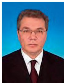
Калашников Леонид Иванович, депутат Государственной Думы пятого созыва с апреля 2010 года, первый заместитель председателя Комитета Государственной Думы по международным делам