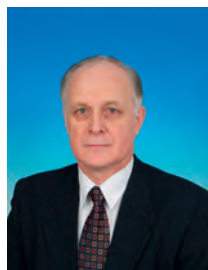
Федоткин Владимир Николаевич, депутат Государственной Думы, член Комитета Государственной Думы по бюджету и налогам