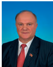
Зюганов Геннадий Андреевич, руководитель фракции КПРФ в Государственной Думе, член Комитета Государственной Думы по науке и наукоёмким технологиям