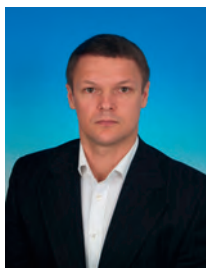
Багаряков Алексей Владимирович, депутат Государственной Думы, член Комитета Государственной Думы по финансовому рынку