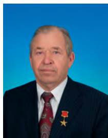
Стародубцев Василий Александрович, депутат Государственной Думы, член Комитета Государственной Думы по аграрным вопросам