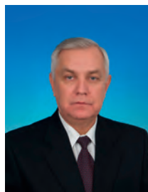
Коломейцев Виктор Андреевич, депутат Государственной Думы, член Комитета Государственной Думы по бюджету и налогам