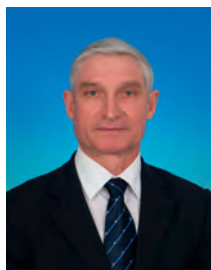
Рябов Николай Фёдорович, депутат Государственной Думы, член Комитета Государственной Думы по промышленности