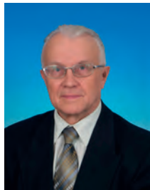
Романов Валентин Степанович, депутат Государственной Думы, член Комитета Государственной Думы по экономической политике и предприни- мательству