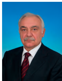
Муравленко Сергей Викторович, депутат Государственной Думы, член Комитета Государственной Думы по природным ресурсам, природопользованию и экологии