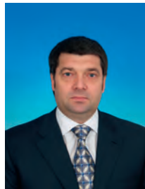
Денисенко Олег Иванович, депутат Государственной Думы, заместитель председателя Комитета Государственной Думы по безопасности