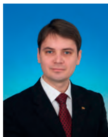
Корниенко Алексей Викторович, депутат Государственной Думы, член Комитета Государственной Думы по строительству и земельным отношениям