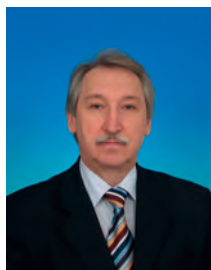
Куликов Александр Дмитриевич, депутат Государственной Думы, заместитель председателя Комитета Государственной Думы по конституционному законодательству и государственному строительству