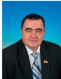
Никитин Владимир Степанович, депутат Государственной Думы, член Комитета Государственной Думы по делам Содружества Независимых Государств и связям с соотече- ственниками