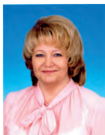
Останина Нина Александровна, депутат Государственной Думы, член Комитета Государственной Думы по вопросам семьи, женщин и детей