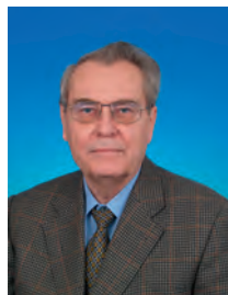
Квицинский Юлий Александрович, депутат Государственной Думы пятого созыва до апреля 2010 года, первый заместитель председателя Комитета Государственной Думы по международным делам