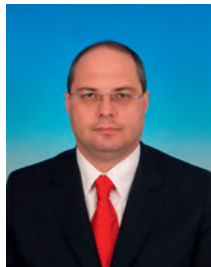
Гаврилов Сергей Анатолевич, депутат Государственной Думы, заместитель председателя Комитета Государственной Думы по транспорту