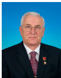
Романов Пётр Васильевич, депутат Государственной Думы, заместитель председателя Комитета Государственной Думы по проблемам Севера и Дальнего Востока