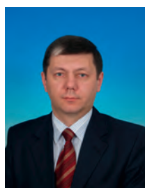
Новиков Дмитрий Георгиевич, депутат Государственной Думы, член Комитета Государственной Думы по культуре