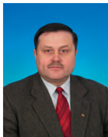
Соловьёв Вадим Георгиевич, депутат Государственной Думы, член Комитета Государственной Думы по конституционному законодательству и государственному строительству